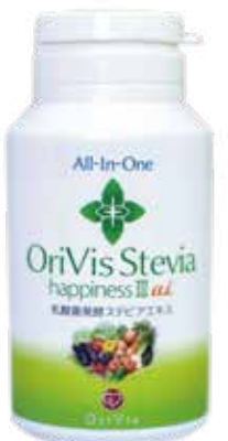
内容量：250mg X 200粒